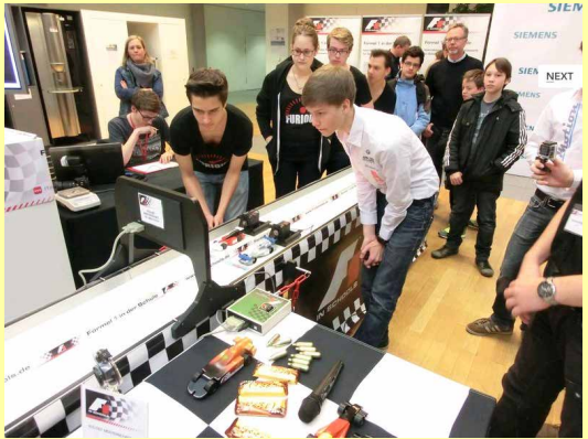
Formel 1 in der Schule - Wettbewerb