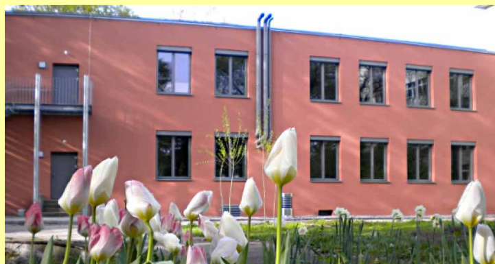
Naturwissenschaftlicher Trakt des Jakob-Fugger-Gymnasiums

Und hier kommt der Förderverein unserer Schule ins Spiel: Wir wollen dazu beitragen, dass die Schülerinnen und Schüler des Jakob-Fugger-Gymnasiums möglichst vielseitige Erfahrungen im Lebensraum Schule sammeln können. Uns leitet dabei der Gedanke, die gesetzlich festgelegte Pflicht der Schulen zur Bildung von Geist und Körper, Herz und Charakter in die Praxis zu übersetzen.