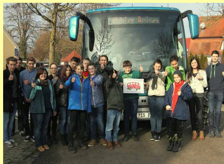
Fahrt zu den Probentagen mit über 130 Schülern aus Streicherklasse, Bläserklasse, Kammerorchester, Holzblasenssemble, Concert-Band, Unter-, Mittel- und Oberstufenchor.

Wir brauchen Ihre Unterstützung. Zusammen schaffen wir ein positives Lernumfeld für Ihr Kind.